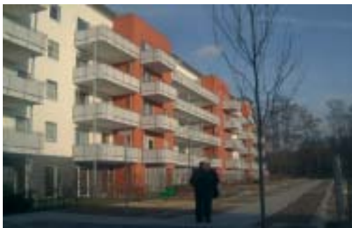
Weihnachten verbrachten die Erwerber schon in ihren neuen Wohnungen.

Citynah wohnen und doch den Nordpark direkt vor der Haustür haben: Noch in diesem Jahr werden weitere Häuser des zweiten Bauabschnitts bezugsfertig.