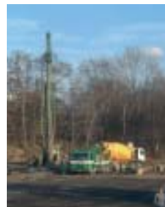
Die Arbeiten für weitere Häuser haben begonnen.