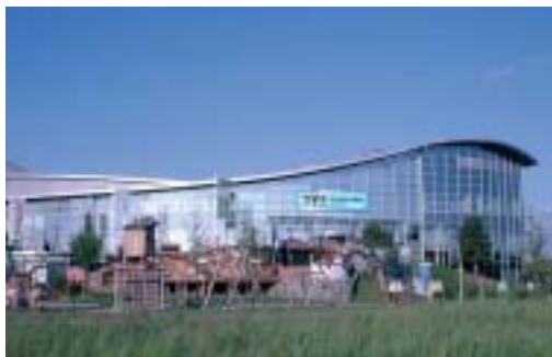
Die JEVER Skihalle Neuss hat neben sportlichen Aktivitäten noch vieles mehr zu bieten.