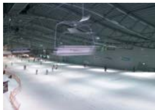
Ab geht's auf die Piste! Bei einer Abfahrtslänge von 300 Metern kommt sogar die Schweizer Nationalmannschaft zum Trainieren.

Aber auch die zahlreichen Events machen einen Besuch lohnenswert: Für Snowboarder gibt es zum Beispiel kostenlose Trainingscamps mit Profis. Im September steht der „Almabtrieb“ auf dem Programm – mit rund 20.000 Teilnehmern und Besuchern inzwischen eine Traditionsvorstellung der Skihalle. Darüber